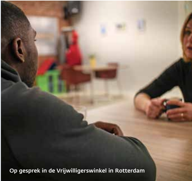
Op gesprek in de Vrijwilligerswinkel in Rotterdam