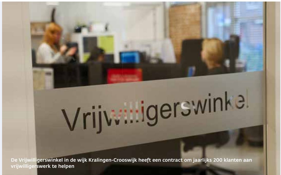
De Vrijwilligerswinkel in de wijk Kralingen-Crooswijk heeft een contract om jaarlijks 200 klanten aan vrijwilligerswerk te helpen

structuur, werkervaring, gezondheid en betekenisgeving. De tegenprestatie is geen straf, maar moet mensen helpen in hun persoonlijke ontwikkeling.