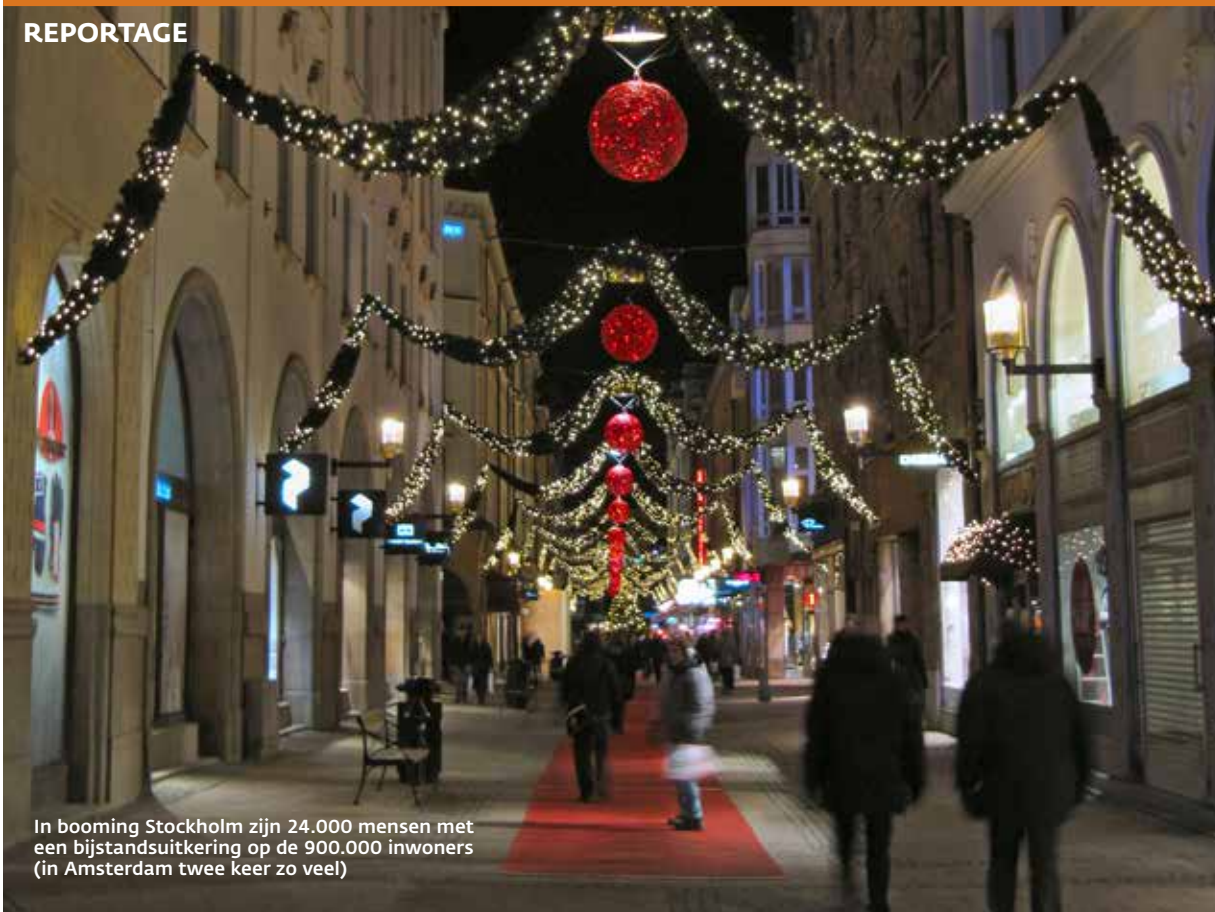
In booming Stockholm zijn 24.000 mensen met een bijstandsuitkering op de 900.000 inwoners (in Amsterdam twee keer zo veel)

aan de orde. Dat begrijpt Ploog. 'In het verleden waren er zelfs 1-euro-banen in de kantine van het regionale arbeidsbureau.' De banen moeten nu echt additioneel zijn. 'Als ze er niet zouden zijn, moet de tent (verzorgingshuis, school etc.) gewoon door kunnen draaien.' Zou je mensen vrijwilligerswerk kunnen laten doen met behoud van uitkering, zoals in Nederland? Ploog is verbaasd. Vrijwilligerswerk? Dat is veel te hoog gegrepen voor de 1-Euro-Jobbers. Vrijwilligerswerk wordt in Duitsland vooral gedaan door 'gegoede burgers', met een betaalde baan. Het zijn vaak vrijwilligers die 1-Euro-Jobbers begeleiden, aldus Ploog. Bovendien: wat geeft meer eigenwaarde? Een baan toch zeker!