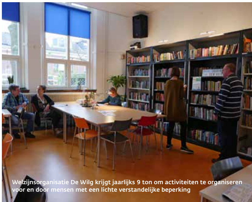
Welzijnsorganisatie De Wilg krijgt jaarlijks 9 ton om activiteiten te organiseren voor en door mensen met een lichte verstandelijke beperking